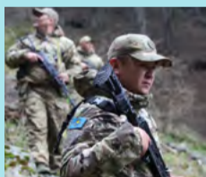
ТҰМАН ТҰМШАЛАҒАН КӨЛ