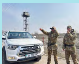
КЕҢ ДАЛАДАҒЫ КІРПІК ҚАҚПАС ҚЫЗМЕТ