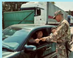
ШЕКАРАДАҒЫ ҮНСІЗ СЕРГЕКТІК