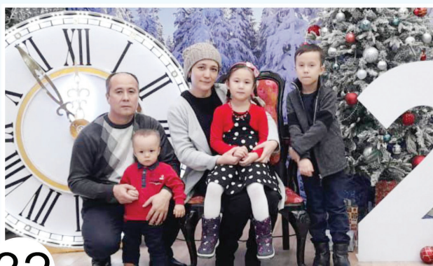
32 ВЕРЕН СВОЕЙ ПРОФЕССИИ