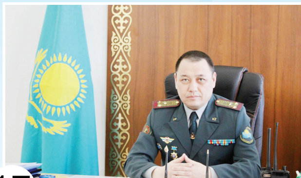
17 СТОЛИЧНЫЙ РАЗМАХ Командир бригады о службе, о людях, о себе