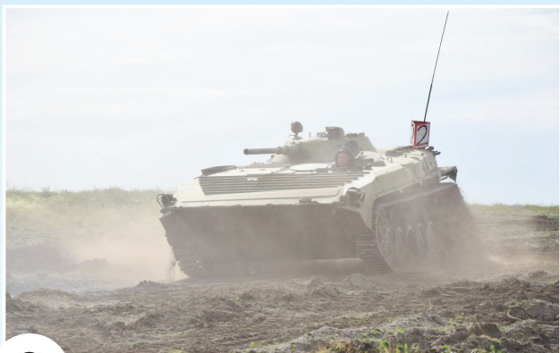
9 СБОРЫ ПРОШЛИ В НОВОМ ФОРМАТЕ