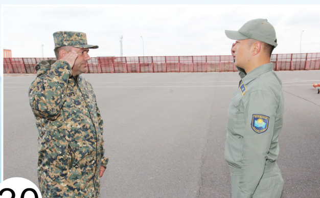
30 ҚЫРАН БОЛМЫСТЫ ҚҰРМАНҒАЛИ