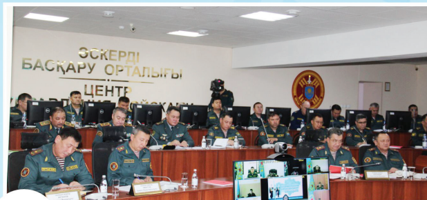
7 СОСТОЯЛОСЬ ЗАСЕДАНИЕ ВОЕННОГО СОВЕТА