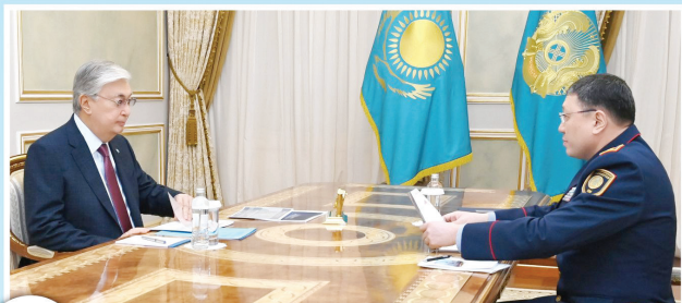
4 БАСТЫ ҰСТАНЫМ: ЗАҢ ЖӘНЕ ТӘРТИП