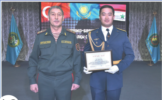
18 ГУМАНИТАРЛЫҚ ЖҮКТЕРДІ ТАСЫМАЛДАҒАН ҰЛАНДЫҚ ҰШҚЫШТАР МАРАПАТТАЛДЫ