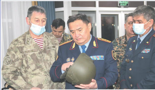
4 МИНИСТР ВНУТРЕННИХ ДЕЛ ОЗНАКОМИЛСЯ С НОВОЙ ТЕХНИКОЙ И ВООРУЖЕНИЕМ НАЦИОНАЛЬНОЙ ГВАРДИИ