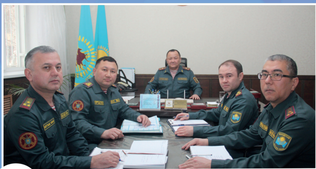
22 БЕЗ ТЫЛА НЕТ ПОБЕДЫ