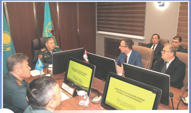
20 В ДУХЕ ТЕСНОГО СОТРУДНИЧЕСТВА