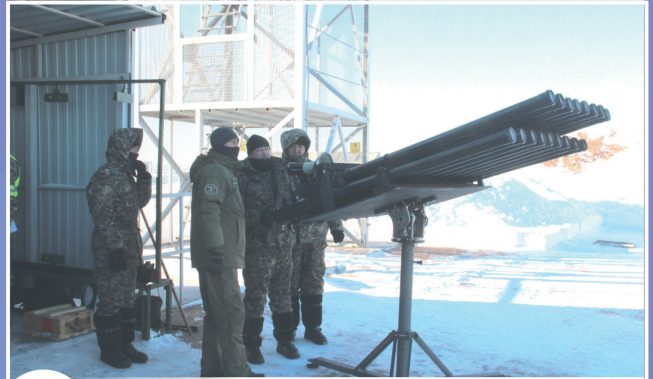
14 АСТАНАДА ҚР ҰЛТТЫҚ ҰЛАНЫҢ БАСШЫЛЫҚ ҚҰРАМЫ ЖЕДЕЛ ДАЙЫНДЫҚТАН ӨТТІ