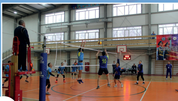
38 ВОЛЕЙБОЛДАН ТУРНИР ӨТТІ