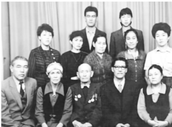
Бір бөлшегіне айналды.

Бекір ағамның бойындағы өңердің бір ұшқаны маған да дарыса көрек. Өйткені адамның жүрегіне жақын, жанын тербеткен өуен бір көрсеніп, бір естіген ұмтылмайды. Ол қорықпен төрбелімен, көрген өңімен бірге келеді екен. Бала кезімде төтемнің домбыра ұстап, өн салған сәттерін көріп өскен біз үшін музыка өмірдің ажырамас-