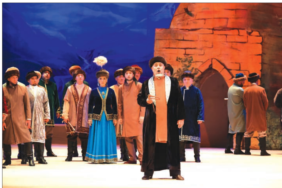
КазНТОБ имени Абая завершил 91-й театральный сезон