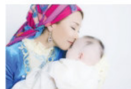
«АЙНАЛАЙЫН» ДЕЙТІН АТА-АНА АЗ