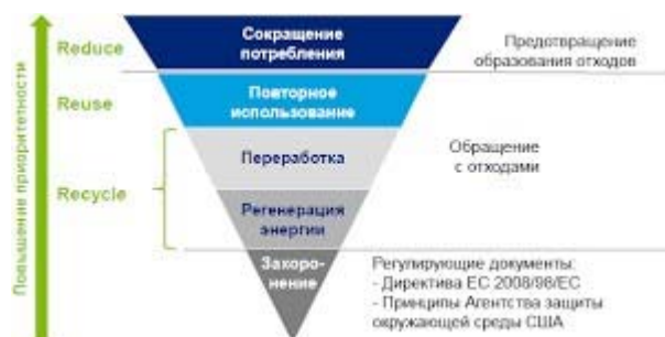
Рис. 3.1 – Иерархия с обращениями отходами.

При применении принципа иерархии должны быть приняты во внимание принцип предосторожности и принцип устойчивого развития, технические возможности и