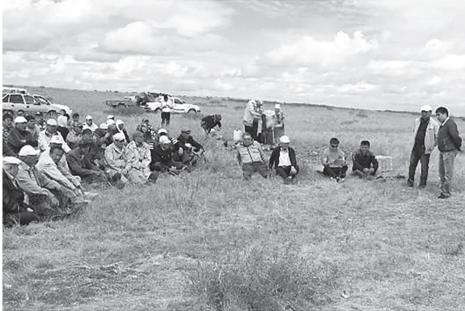
Матақ батырдың кесенесінде ас беріп Құран бағыштау. 2015 жыл