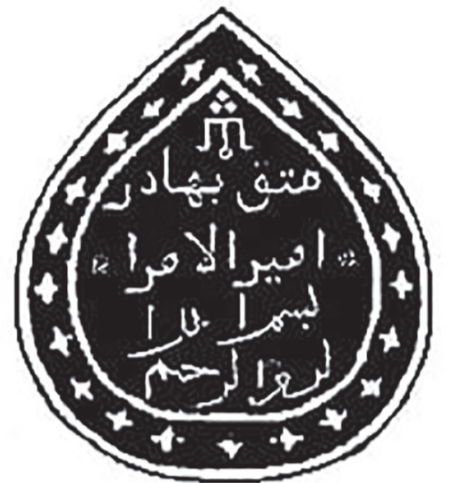
Қарқаралы дуанының әмірі Матақ батырдың мөрінің таңбасы

2015 жылы Қарағанды облысының мәдениет басқармасының «Тарихи және мәдени ескерткіштерді сақтау және қорғау бөлімінің» мамандары Матақ батыр кесенесіне күрделі жөндеу жұмыстарын жүргізді. Кесененің сырты темір шарбақпен қоршалды, тозған қабырғаның элементтері жаңартылды, айналасы ретке келтірілді. Матақ батыр кесенесі Қазақстан Республикасының мемлекет қорғауына алынған ескерткіштер қатарын енгізілді. Осы салтанатты шараға Қарағанды облыстық мәдениет бөлімінің мамандары, Қарқаралы аудандық әкімшілігі қызметкерлері, баспасөз өкілдері, аудандық мұражай қызметкерлері және Батырдың ұр-