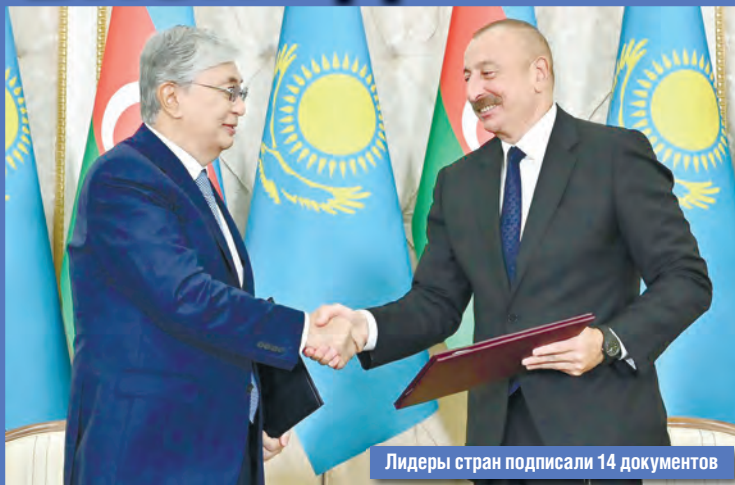
Лидеры стран подписали 14 документов

Азербайджанской Республики между АО «Национальная компания «КазМунайГаз» и государственной нефтяной компанией Азербайджанской Республики.