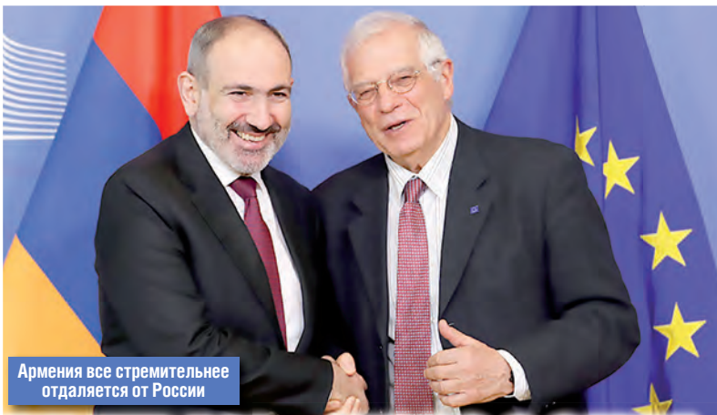
Армения все стремительнее отделяется от России

В приоритете развитие отношений с соседними странами, уточнил он. Мирзоян добавил, что Армения строит «совершенно новые качественные отношения» с разными государствами, например с Индией.