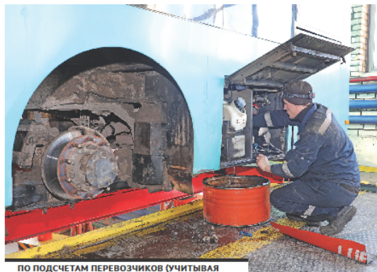
ПО ПОДСЧЕТАМ ПЕРЕВОЗЧИКОВ (УЧИТЫВАЯ ЗАТРАТЫ НА ЗАРПЛАТУ ВОДИТЕЛЯМ, АМОРТИЗАЦИЮ, ГСМ И ДРУГИЕ), РЕАЛЬНАЯ ЦЕНА ЗА ПРОЕЗД - 320 ТЕНГЕ.

Наибольшее число автобусов можно различить по цветам. Зеленые - для внутригородских маршрутов, синие - для пригородных. За прошлый год мы перевезли свыше 66 миллионов