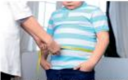
Балда салмақ асығып-асығып 29 пайызға артты. Семіздікпен ауыратын балалардың денсаулығын бақылауға қажет.

Артық салмақ ер балалар арасында өткізіліп жатыр. Мысалы, бұл ер балалары балалардың денсаулығын бақылауға баулауға қажет. Семіздікпен ауыратын балалардың денсаулығын бақылауға қажет. Семіздікпен ауыратын балалардың денсаулығын бақылауға қажет. Семіздікпен ауыратын балалардың денсаулығын бақылауға қажет.