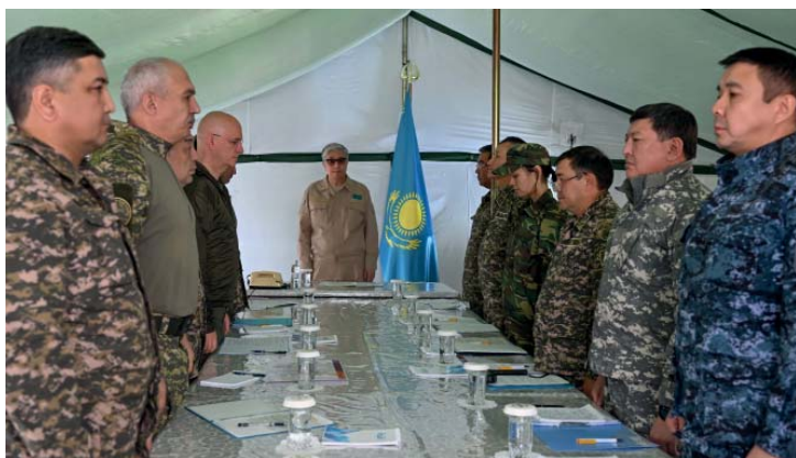
Абай облысы, Бородулиха ауылы

Президент Қасым-Жомарт Тоқаев Абай облысындағы алапат өртеке байланысты Төтенше жағдайлар жөніндегі жедел штабтың отырысын өткізді.