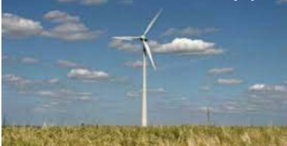
«Самұрық-Қазына» мен қытайлық СРІН Жамбыл облысында жел электр стансасын салуды жоспарлап отыр.