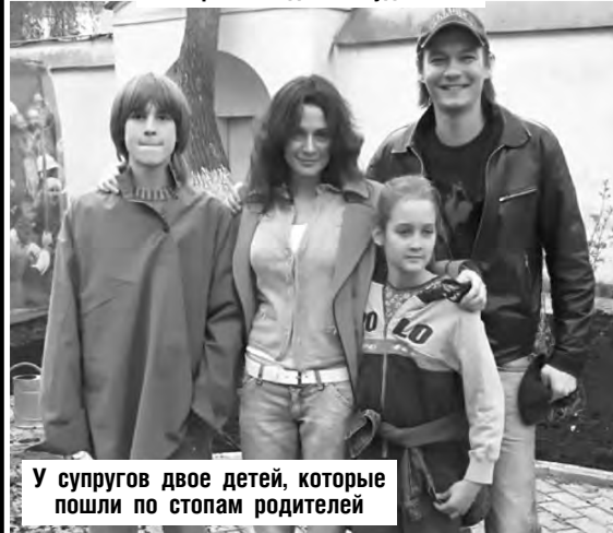
У супругов двое детей, которые пошли по стопам родителей