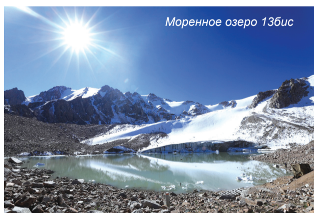
Моренное озеро 13бис

Круглосуточный контроль за гидрометеорологической ситуацией и за состоянием моренных озер будет осуществляться посредством автоматизи-