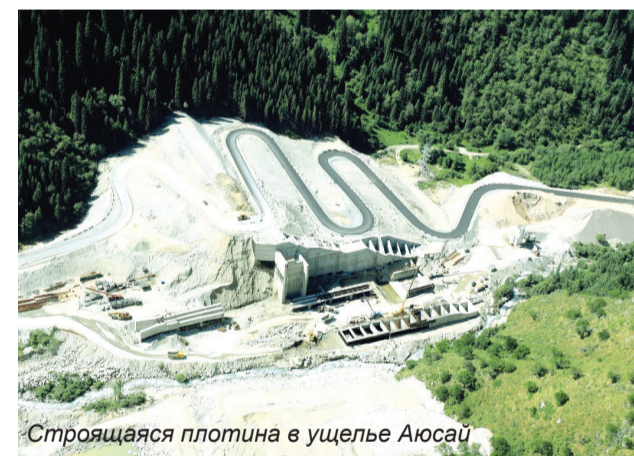
Строящаяся плотина в ущелье Аюсай

Для кардинального решения вопросов селевой безопасности в городе Алматы продолжается строительство двух селезадерживающих плотин в ущельях Аксай и Аюсай.