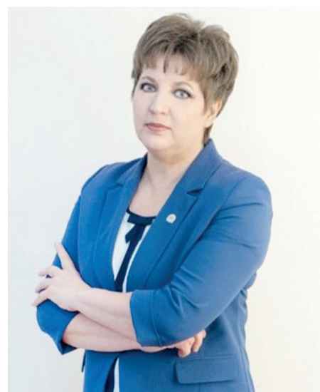
Лариса ПАВЛОВЕЦ, депутат Мажилиса Парламента РК

- Нельзя сказать, что у нас в стране нет паллиативной помощи, потому как в Кодексе РК «О здоровье народа и системе здравоохранения» четко указано и дано ему определение. Паллиативная медицинская помощь - комплекс медицинских услуг, направленных на облегчение боли и тяжелых проявлений заболеваний неизлечимо больного пациента при отсутствии показаний к проведению радикального лечения, - отметила спикер.