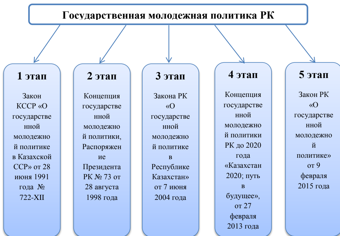
Рисунок 1. Развитие нормативно-правовой базы Республики Казахстан по молодежной политике

Первый этап начался в середине 1991 года в момент принятия Закона Казахской Советской Социалистической Республики от 28 июня 1991 года № 722-ХП «О государственной молодежной политике в Казахской ССР».