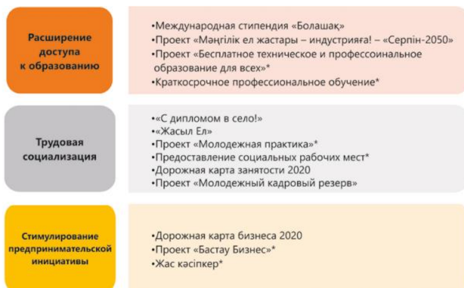
Рисунок 2. Государственные программы и проекты, предназначенные для молодежи по направлениям.

* Примечание: Государственная программа развития продуктивной занятости и массового предпринимательства на 2017–2021 годы «Еңбек» (далее – Программа «Еңбек»)