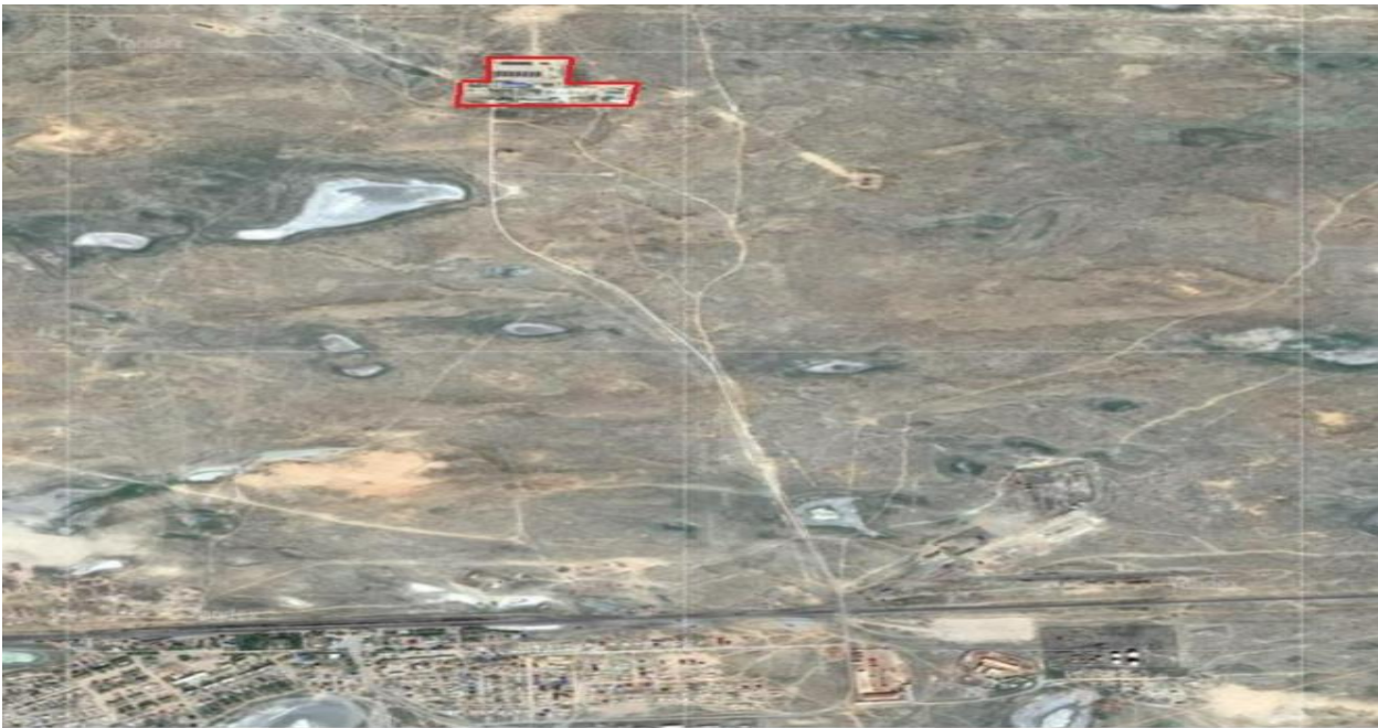
Рисунок – 7. Карта расположения площадки №4 АГРС «Акколь-2»

Негізгі өндірістерге қызмет көрсету үшін кәсіпорында келесі қызметтер мен құрылыстар бар: