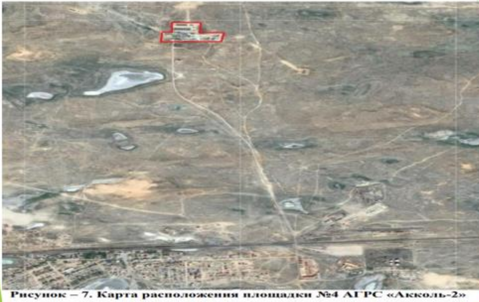
Рисунок – 7. Карта расположения площадки №4 АГРС «Акколь-2»

Негізгі өндірістерге қызмет көрсету үшін кәсіпорында келесі қызметтер мен құрылыстар бар: