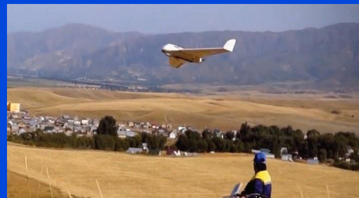
ДОСТАВКА ГАЗЕТ И ЖУРНАЛОВ ДРОНАМИ