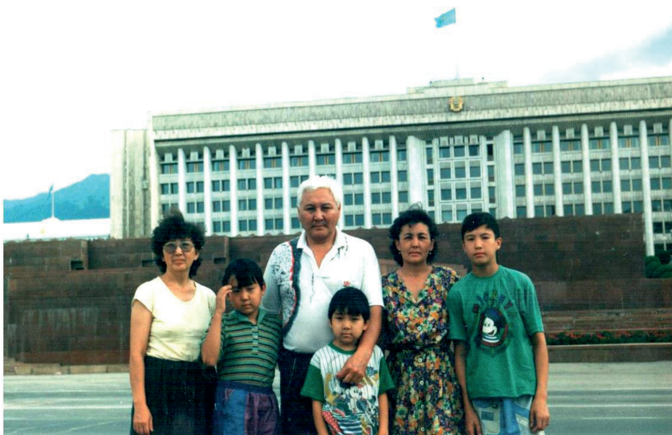
Орынбек с семьей

тать под руководством Касым-Жомарт Кемелевича и я всегда восхищался его человеческими и организаторскими качествами, феноменальной памятью.