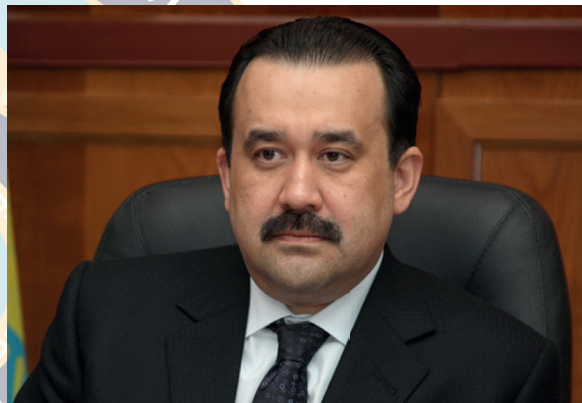
Карим МАСИМОВ, Председатель КНБ РК, генерал-лейтенант

Система национальной безопасности призвана обеспечить гарантии неуязвимости суверенитета страны, территориальной целостности и защиты населения. За годы укрепления государственности благодаря взвешенной внутренней и внешней политике Первого Президента Республики Казахстан – Елбасы Нурсултана Назарбаева удалось сохранить наше общество от потрясений, а страну от развала, преодолеть все риски и трудности современного мира. Он двигался быстро и ломал стереотипы; он не боялся оспаривать статус-кво.