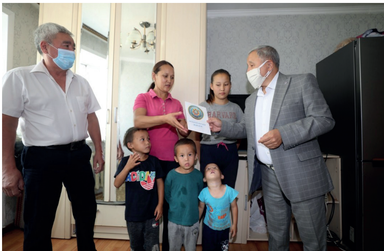
Көпбалалы отбасыларға көмек көрсету акциясы кезінде