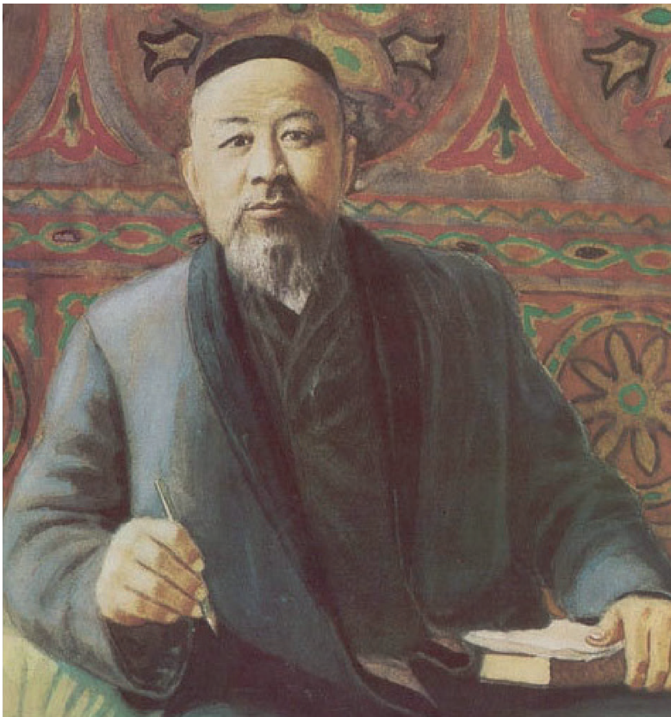
Абай. сүретті салған А. Кастеев