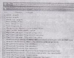
скр. №2 папка «2015» - «Аудио»