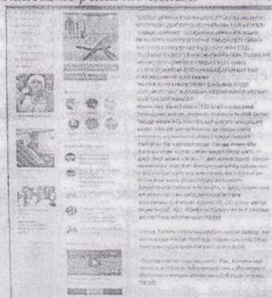
скриншот файла №4291

В текстах аудиолекций о праздновании нового года, содержится критика тех верующих-мусульман, которые «подражают» неверным в праздновании христианского праздника «уподобляются» им, тем самым являются предателями религии Аллаха, так как празднование светских народных праздников, не признанные в исламе (среди представителей салафитского направления радикального толка) является запретным, оскорбляющим религию ислам.