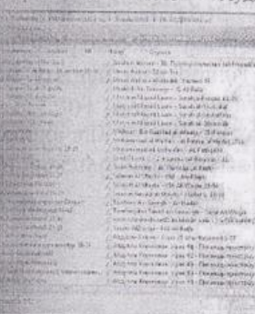
скр. №5.6 папка «Алмас 2016» - «ВК АУДИО Алмас»