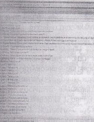
скр. №3.4 папка «2015» - «Аудио»